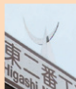
兜の前立 青葉通東二番町の 標識