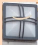
兜の前立 アーケードの 入口