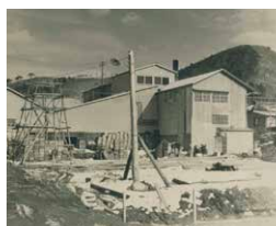
創業間もない昭和37年頃の写真。