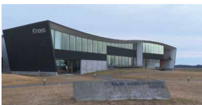
昭和32年(1957年)創業。もともと石巻にあり、震災で甚大な被害を受けました。