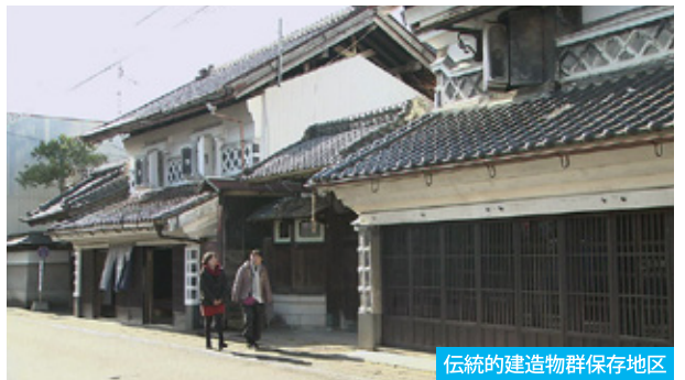
伝統的建造物群保存地区

江戸時代の建物が残されている村田町。情緒あふれる街並みを散策しながら、この町ならではの酒を味わってみませんか。