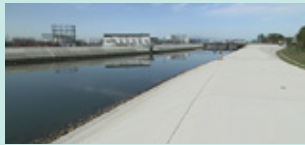
復旧後、現在の砂押川堤防