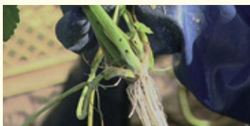
一番おいしい根ごと茎の根際