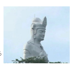
船岡城址公園にある「船岡平和観音」