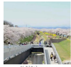
せんおうきょう 「しばた千桜橋」から眺める風景は圧巻です