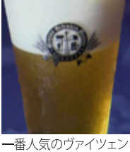
一番人気のヴァイツェン