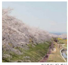
ひとめせんぼんざくら 桜の名所である「一目千本桜」は、町のシンボリック的存在です