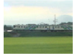
蔵王連峰を望みながらの田園風景の中を走り抜けます