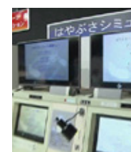
子供も楽しめる体験コーナー

宇宙開発の町として知られる角田市には、JAXA(宇宙航空研究開発機構)の研究施設があります。