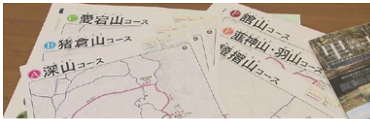
柴田町里山ハイキングコースは、全部で6つのコース。