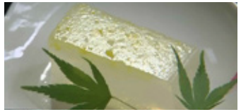
北限の柚子として知られる「雨乞の柚子」を使った寒天が人気です。

とみぞわまがいぶつくん 富沢磨崖仏群 こくろうぼざつ によりんかんのん 虚空蔵菩薩や如意輪観音など10以上もの石仏が集まっています。