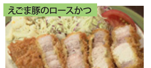
えごま豚のロースかつ