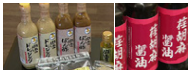
エゴマのぼん酢、ドレッシング、醤油などの加工品