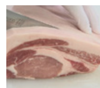
エゴマを飼料に育てられたえごま豚。