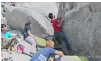
安全に配慮して、持参したマットを敷いて楽しみます。