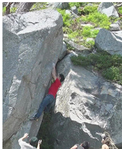
ボルダリングとは、高さ3メートルから5メートルほどの岩をロープなしで登るスポーツクライミングの一種。