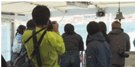
女川港から35分ほどの爽やかな船旅を終えて金華山に到着。