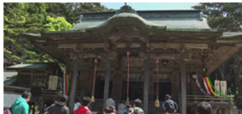
金華山黄金山神社で今日の安全をお祈りします。