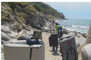
神社から徒歩約40分、金華山に10カ所ほどあるボルダリングエリアに到着です。