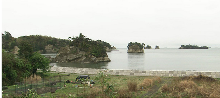
塩竈市浦戸諸島は、松島湾の入り口にあり、人が住んでいるのは、桂島、野々島、寒風沢島、朴島の4島です。

仙台市中心部からJRと船で約1時間で行くことができる浦戸諸島。ゆったりとした気分を味わいながら島歩きを楽しんでみませんか。