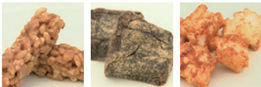
仙台きなこクランチ 黒蜜きなこもち 仙台きなこおかし

宮城県産大豆を使用した商品で、女性に人気。このお菓子には、復興への思いが込められています。