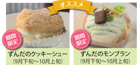
ずんだのクッキーシュー (9月下旬~10月上旬)