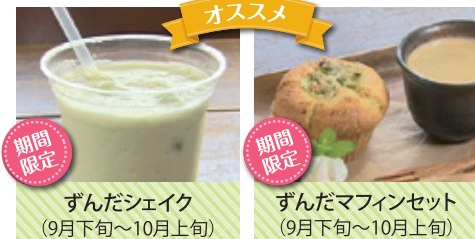
ずんだシェイク (9月下旬~10月上旬)