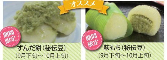
ずんだ餅(秘伝豆) (9月下旬~10月上旬)