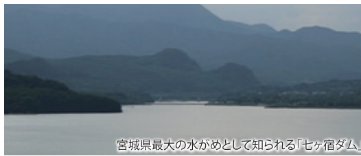
宮城県最大の水がめとして知られる「七ヶ宿ダム」