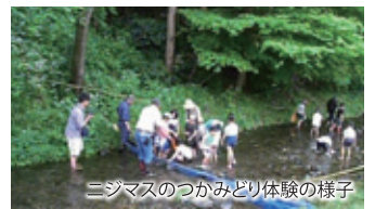
ニジマスのつかみどり体験の様子