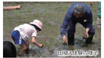
田植え体験の様子