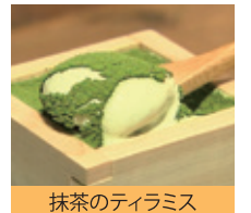
抹茶のティラミス