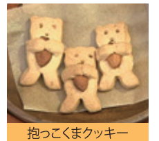
抱っこくまクッキー