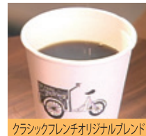
クラシックフレンチオリジナルブレンド