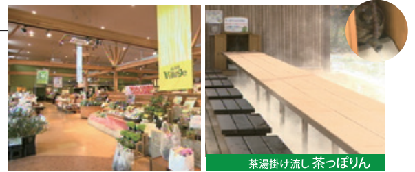
茶湯掛け流し 茶っぼりん

秋保ヴィレッジの中にある、物産館「アグリエの森」は地元生産の新鮮な野菜やお惣菜などを販売しているほか、食事ができる場所があります。屋外テラス席にはお茶を使った足湯の「茶っぼりん」もあります。