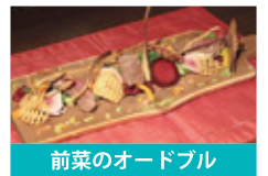
前菜のオードブル