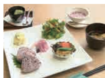
古代米ランチ(さくら米セット)