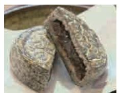
あくたまこせん 阿久玉御前