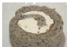
多賀城古代米ロール