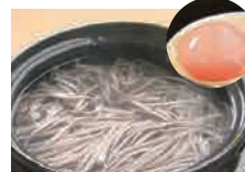
おもわく麺(たまごつけ麺)

古代米の米粉を練り込んだ麺に、古代米を餌にして育った鶏の卵をからめて味わいます。