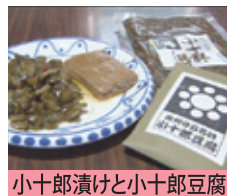
小十郎漬けと小十郎豆腐