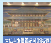
大仏開眼供養記図(陶板画)