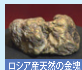
ロシア産天然の金塊