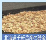
北海道千軒岳産の砂金