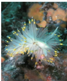
ハナヤナギウミウシ