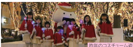
昨年のコスチューム姿

光のページェントの親善大使的な活躍してくれる小学生の子どもたち。募金活動やイベントのお手伝いに参加します。