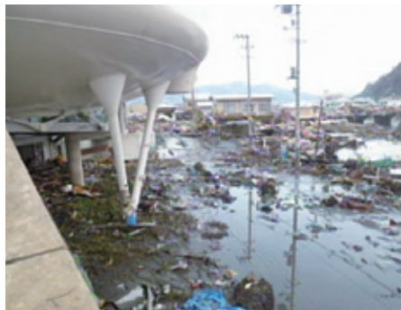
2011年3月 震災直後の萬画館

2013年3月、石巻市の石ノ森萬画館が復活しました。石巻は石ノ森さんが映画を見るために通ったまち。功績をたたえてそのゆかりの地に建てられた萬画館でしたが、震災で大きな被害を受けました。リニューアルオープンした萬画館には、新しいコーナーがいくつも誕生。震災を乗り越え、萬画で結ばれる街石巻の、新たな魅力に触れてみませんか?