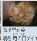
高温型石英 別名 竜の口ダイヤ