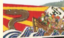
*宝船が描かれたコンテナ (作品の一つ)

「震災ですべてを失った漁師さんからの依頼で、漁具を入れるコンテナに絵を描いています。浜から離れ、石巻から通っている漁師さんが、朝早くて暗いときに何もなくなった浜を通ると寂しいけれど、コンテナが目に入ると、人の温かみを感じるし安心するという話をよくしてくれます」