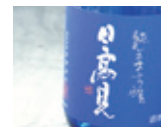
純米大吟醸日高見 ブルーボトル 魚料理との相性が抜群。

[飲んで被災した酒蔵を助けよう]という動きが全国に広まりました。『希望の光』は完売しましたが、設備を新しくして酒造りを再開、12月から純米大吟醸日高見が売り出されています。