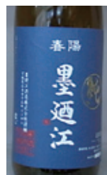
墨迺江 特別純米酒 石巻の豊富な魚介類に合うように造られました。